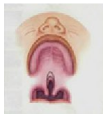
Расщелина мягкого нёба

Внешне дефект не заметен. Чаще всего, о том, что у ребёнка расщелина нёба, знают только близкие. Уранопластика проводится в возрасте 1-1,5 года, при недоразвитии нижней челюсти 1,5-2 года. Для предупреждения речевой патологии оперативное лечение должно быть проведено до формирования речи.