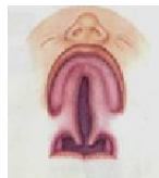
Расщелина твёрдого и мягкого нёба